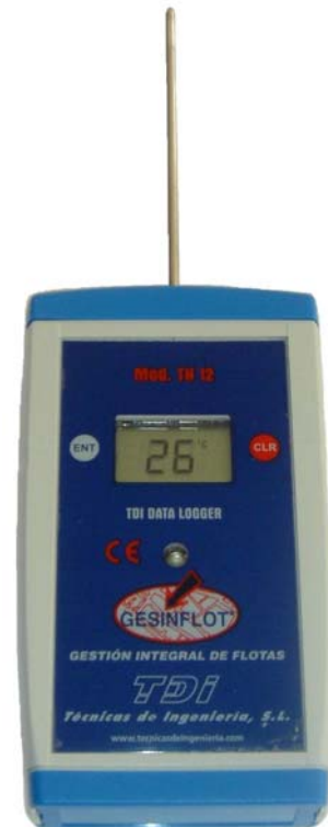
TERMÓGRAFO DE TEMPERATURA